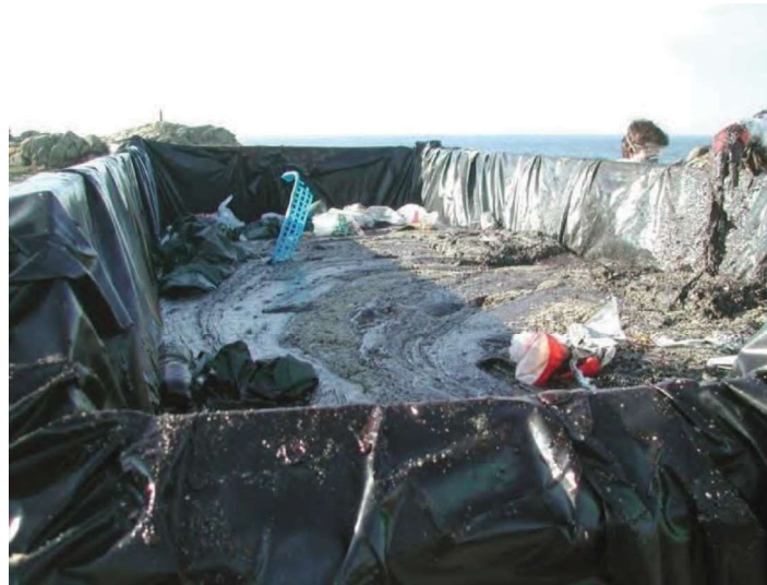
Déchets triés incorrectement : Déchets solides et pâteux regroupés